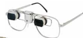
SightScope® Compact 0.5x Field Expander